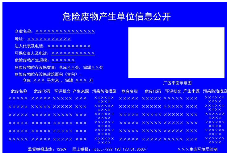
危险废物 信息公开 栏

1、设置位置 采用立式固定方式固定在危险废物产生单位厂区门口醒目位置，公开栏顶端距离地面200cm处。 2、规格参数 (1) 尺寸：底板120cm×80cm。 (2) 颜色与字体：公开栏底板背景颜色为蓝色，文字颜色为白色，所有文字字体为黑体。 (3) 材料：底板采用5mm铝板。 3、公开内容 包括企业名称、地址、法人代表及电话、环保负责人及电话、危险废物产生规模、贮存设施建筑面积和容积、贮存设施数量、危险废物名称、危险废物代码、环评批文、产生来源、环境污染防治措施、厂区平面示意图、监督举报途径、监制单位等信息。